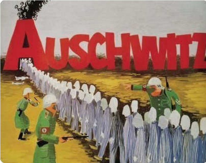
איור: יוסף באו