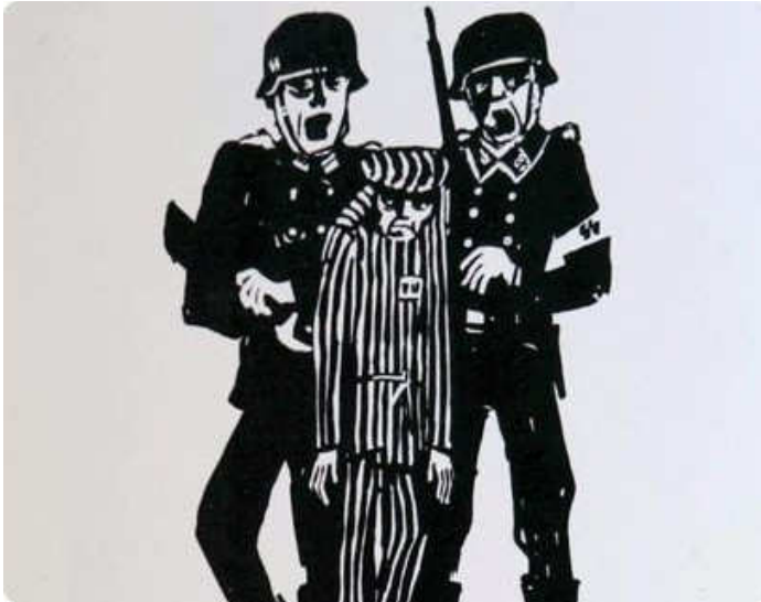
איור: יוסף באו