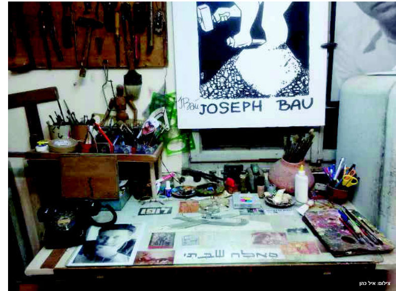
The Joseph Bau House tells the story of the multidisciplinary artist, whose talent and optimism assisted him to survive even the most difficult situations

Joseph Bau House La maison de Joseph Bau